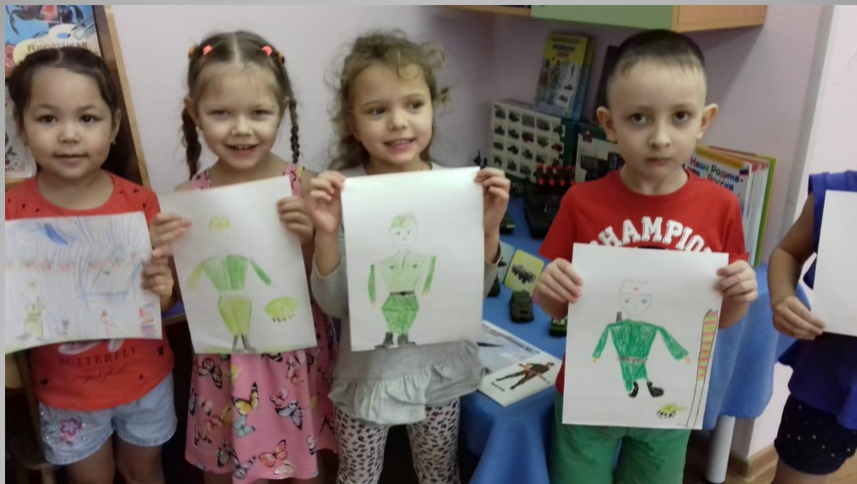
Портрет «Мой папа защитник»