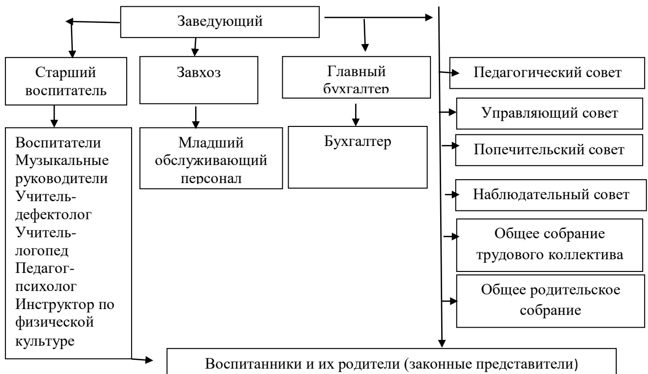
Схема 1. Структура управления Учреждением

Порядок выборов коллегиальных органов управления Учреждения и их компетенции определяются Уставом Учреждения.